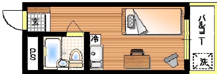
※略図につき現状優先とします。