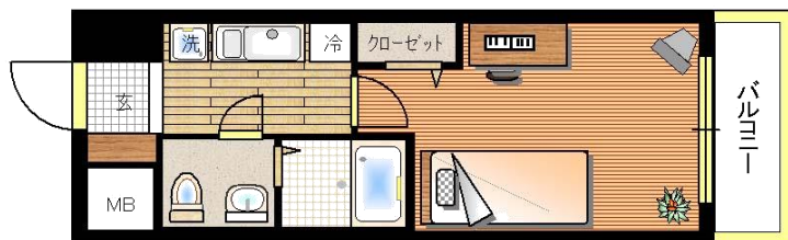
※略図につき現状優先とします。